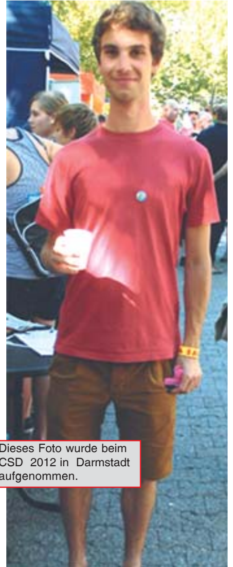
Dieses Foto wurde beim CSD 2012 in Darmstadt aufgenommen.