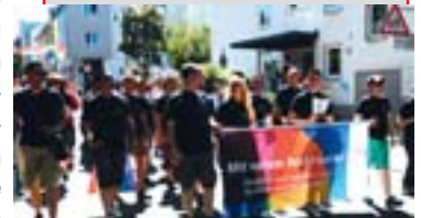
Wunderbares Wetter, gutge-launte BesucherInnen und

Eine für Darmstadt beachtlich große Parade, ein tolles Fest auf dem Riegerplatz, der die Teilnehmer kaum aufnehmen konnte, eine bemerkenswerte kämpferische politische Rede des Oberbürgermeisters, der auch in diesem Jahr Schirmherr war, das waren die Kennzeichen des Darmstädter CSDs.