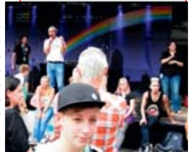
AktivistInnen an den Ständen, auch noch als schon abgebaut wurde. Wir werden gerne wieder zu Euch kommen. js/rs