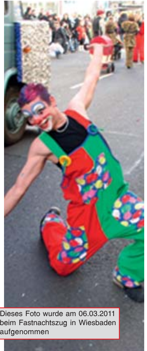
Dieses Foto wurde am 06.03.2011 beim Fastnachtszug in Wiesbaden aufgenommen