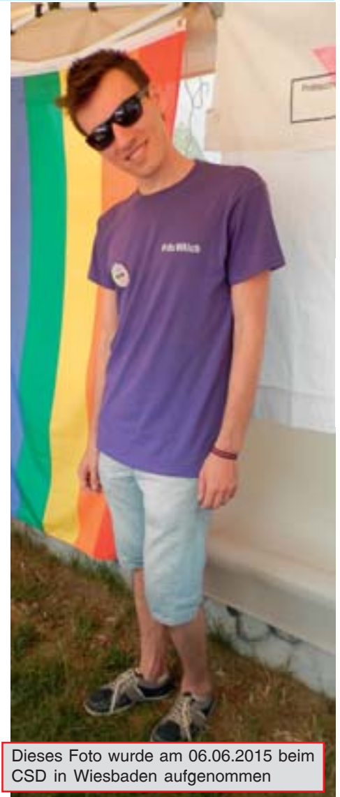
Dieses Foto wurde am 06.06.2015 beim CSD in Wiesbaden aufgenommen

Landtag. Nun wollen wir uns aber mal nicht so sehr beklagen, denn gegenwärtig geht es uns ja noch relativ gut, sogar besser als je, und zur Gleichstellung wäre es kein so weiter Weg. Deutlich schlechter würde es uns ergehen, wenn irgendeine Partei (Union oder FDP) in eine Koalition mit der AfD oder NPD (oder entsprechende Nachfolger) gehen würde. Oder glaubt ihr, dass es dieses mal besser für uns alle ausgehen würde als damals 1933? Die AfD-WählerInnen wären Protestwähler, hätten kein geschlossenes rechtes Weltbild, sagt man uns. Das ist dann recht schnell da, wenn man es braucht. Wenn diese Menschen sich nicht scheuen, diese Partei zu wählen, obwohl sie doch wissen, welche Übergänge nach rechts vorhanden sind, dann kann man es mit der Angst zu tun bekommen. Aber wenn es drauf ankommt, sah es ja bei der Wahl erst einmal gut aus. js